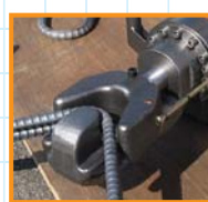
■現場で役立つ同時曲げ