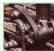
■腰への負担を減らします