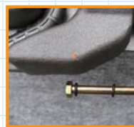
■無段階で曲げ調整